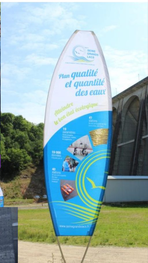
Oriflamme: atelier plan de gestion des eaux