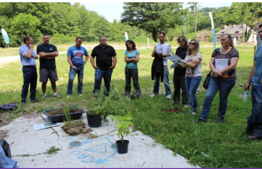
Atelier: plantes invasives