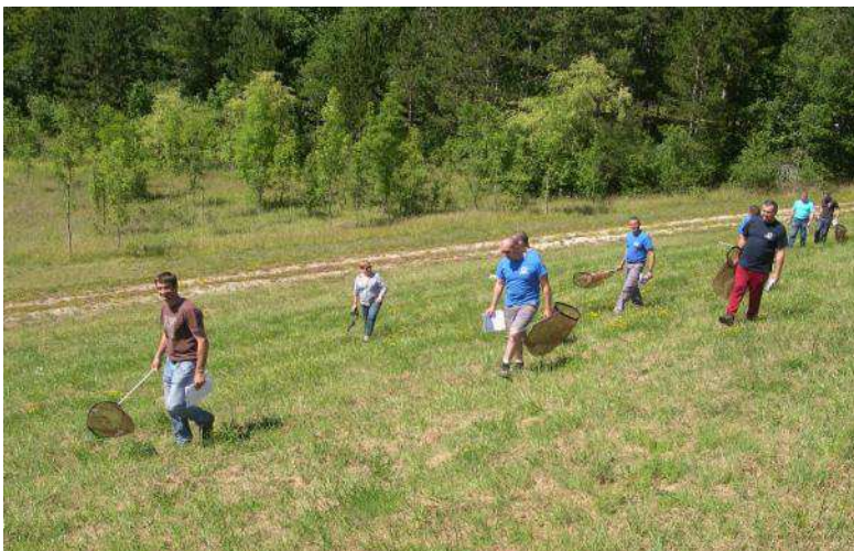
Session de recensement des papillons de jour