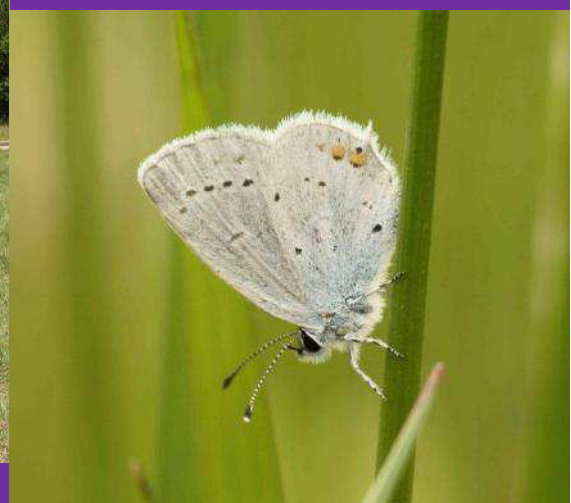
Azuré du trèfle