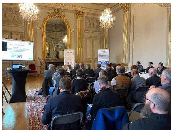
Figure 4: Comité de pilotage du PEP