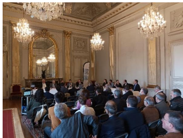
Figure 3 : Conférence territoriale de lancement du PEP

Cette conférence a permis de réunir pour la première fois les acteurs locaux concernés par le projet et officialiser le début de la démarche PAPI sur ce Territoire à Risques importants d'Inondation (TRI). A cette occasion, la convention Seine Grands Lacs – Syndicat Mixte de la Marne Moyenne fût signée par les deux Présidents.